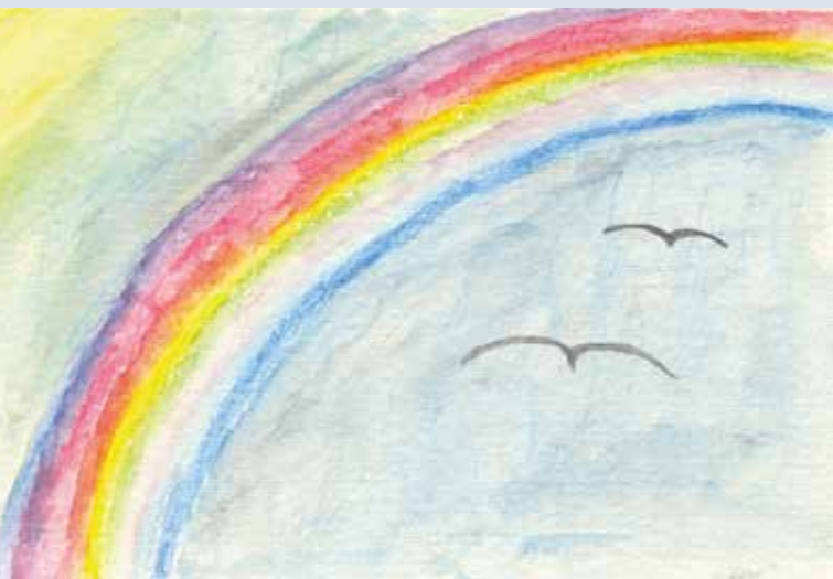
Bachmeier K.: Regenbogen

I n der begleiteten Trauergruppe für »Verwaiste Eltern« sollen Mütter und Väter/Ehepaare, die ein Kind durch Krankheit, Unfall oder auf sonstige tragische Weise verloren haben, Zuwendung und Verständnis finden.